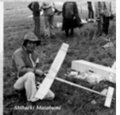
Alhacker / Monahan